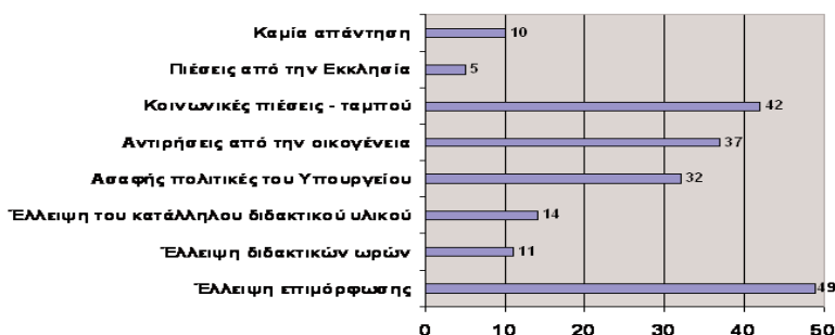
Σχήμα 3. Ανασταλτικοί παράγοντες 53 για την εφαρμογή σεξουαλικής αγωγής

Τα εμπόδια (σχ. 3) που λειτουργούν ανασταλτικά στην εισαγωγή της σεξουαλικής αγωγής στο δημοτικό σχολείο ήταν μια άλλη ερώτηση αυτής της έρευνας (ανοικτή ερώτηση, Παράρτημα Β, ερώτηση 23).