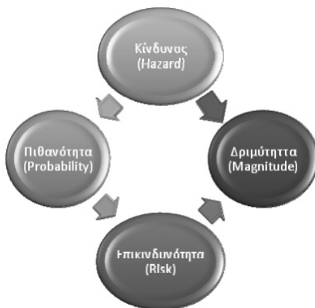
Διάγραμμα 3. Διαχείριση κινδύνου κατά την ερευνητική διαδικασία

Σε γενικές γραμμές, ένας κίνδυνος μπορεί να προκαλέσει σοβαρές ανισορροπίες σε μία έρευνα. Μέσω της διαχείρισης κινδύνου, η επιχείρηση αποφασίζει, διαχειρίζεται, μετρά και εφαρμόζει μέτρα μετριασμού του. Χωρίζεται στις εξής φάσεις: α) Προσδιορισμός κινδύνων, β) Ανάλυση κινδύνων (πιθανότητα και αποτελέσματα), γ) Προγραμματισμός διαχείρισης (στρατηγικές αποφυγής, ελαχιστοποίησης και εναλλακτικά σχέδια) και δ) παρακολούθηση κινδύνων (Kaplan, 1991).