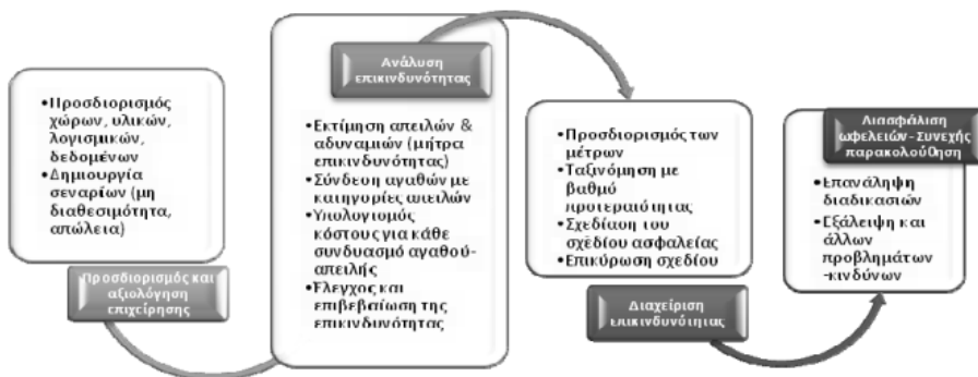
Διάγραμμα 1: Ροή ερευνητικής διαδικασίας