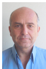
Γράφει ο Βασίλειος Οικονομίδης Καθηγητής Παν/μίου Κρήτης

Ο Θεόδωρος Κολοκοτρώνης (1770-1843) αποτελεί μία από τις κυριότερες μορφές της Ελληνικής Επανάστασης του 1821. Γόνος μεγάλης οικογένειας Κλεφτών και Αρματωλών αρχίζει την δράση του κατά των Τούρκων από την εφηβική ηλικία.