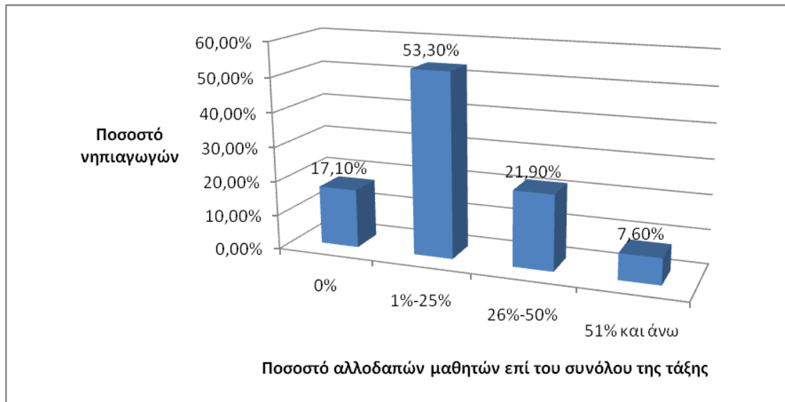
Γράφημα 2: Ποσοστιαία παρουσία αλλοδαπών μαθητών στις τάξεις των νηπιαγωγών του δείγματος.

Σε γενικές γραμμές διαπιστώνουμε ότι τη σχολική χρονιά που διεξήχθη η έρευνα η πλειονότητα των νηπιαγωγών του δείγματος (83%) έχουν αλλοδαπούς μαθητές στην τάξη τους, συχνά σε επίπεδα άνω του 25% των μαθητών τους.