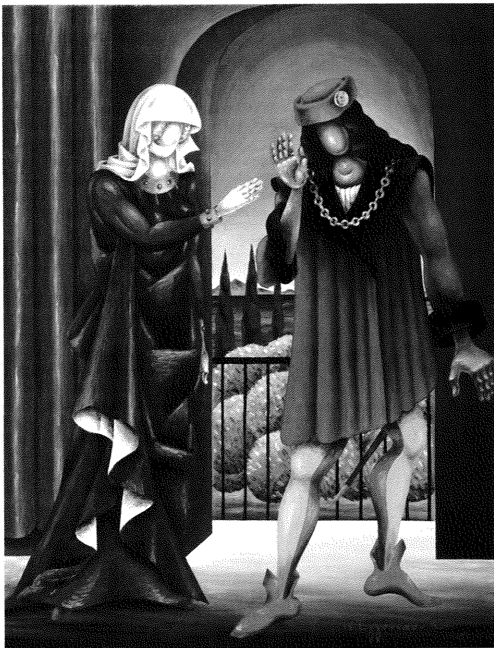
Ν. Εγγονόπουλος, Ερωτόκριτος και Αρετούσα, 1969.