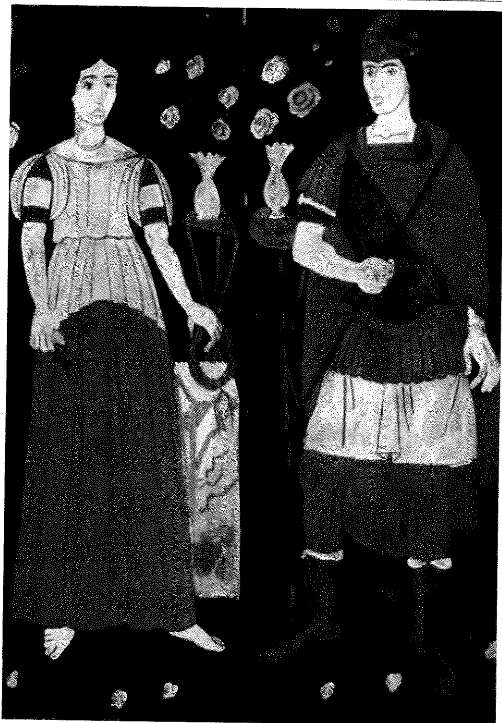
Γ. Τσαρούχης. Ερωτόκριτος και Αρετούσα , 1980.