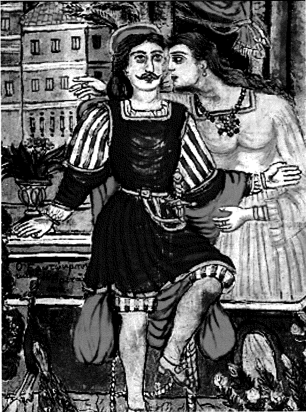
Θεόφιλος, Ο Ερωτόκριτος και η Αρετούσα.